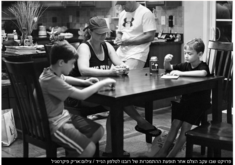
פריקט שבו עקב הצלם אחר תופעת ההתמכרות של רובנו לטלפון הנייד