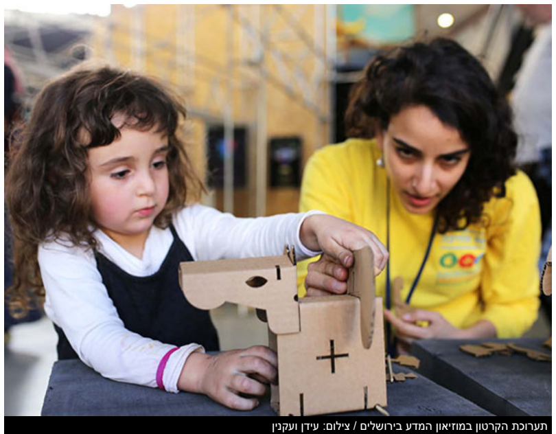
תערוכת הקרטון במוזיאון המדע בירושלים